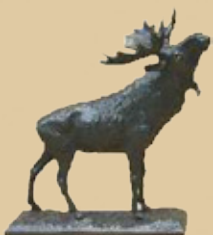
Elch Art.-Nr. 152001 Höhe: 23 cm Gewicht: 2,2 kg 118,99 €