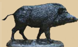
Keiler Art.-Nr. 152036 Höhe: 19 cm Gewicht: 4,4 kg