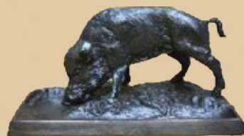
Keiler Art.-Nr. 152039 Länge: 9 cm Gewicht: 1,3 kg