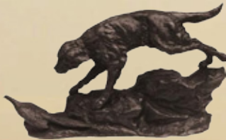
Hund und Fasan Art.-Nr. 152026 Höhe: 34 cm Gewicht: 10 kg