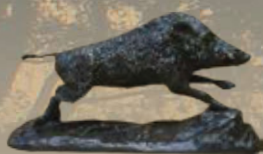
Keiler Art.-Nr. 152041 Höhe: 10 cm Gewicht: 1 kg