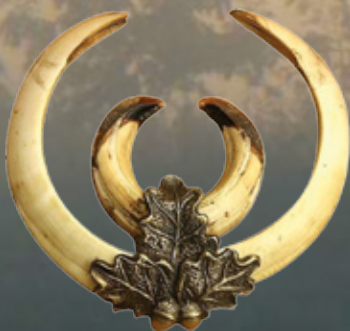
Keilerwaffenabdeckung Art.-Nr. 145007 Maße: 6,5x7cm Gewicht: 0,1kg

Achtung: Keilerwaffenabdeckungen ohne Keilerwaffen