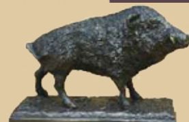
Keiler Art.-Nr. 152034 Höhe: 13 cm Gewicht: 1,8 kg