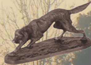
Hund Art.-Nr. 152025 Höhe: 8 cm Gewicht: 1,2 kg