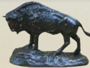
Wiesentulle Art.-Nr. 152031 Höhe: 12 cm Gewicht: 1 kg