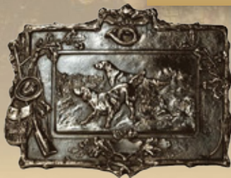
Kamin und Türschilder aus Bronze-guss Art.-Nr. 152009 Maße: 30x24 cm Gewicht: 2,2 kg