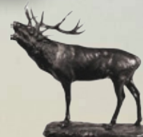
Rothirsch Art.-Nr. 152057 Höhe: 56 cm Gewicht: 19 kg