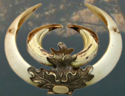
Keilerwaffenabdeckung Art.-Nr. 145006 Maße: 9,0x7,5cm Gewicht: 0,1kg