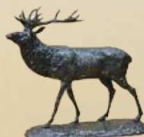
Rothirsch Art.-Nr. 152059 Höhe: 27 cm Gewicht: 3,3 kg