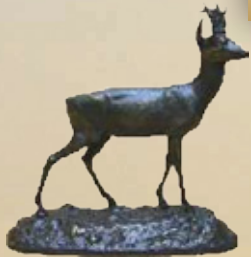
Rehbock Art.-Nr. 152050 Höhe: 20 cm Gewicht: 1,3 kg 80,99 €