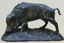
Keiler Art.-Nr. 152039 Höhe: 9 cm Gewicht: 1,3 kg 64,99 €