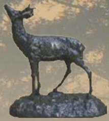
Rehbock Art.-Nr. 152054 Höhe: 19 cm Gewicht: 1,2 kg 75,99 €