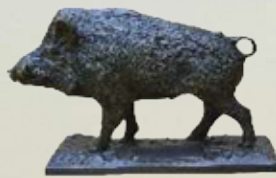
Keiler Art.-Nr. 152037 Höhe: 15 cm Gewicht: 2,2 kg 80,99 €