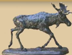
Elch Art.-Nr. 152003 Höhe: 21 cm Gewicht: 3,2 kg 127,99 €