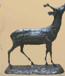
Rehbock Art.-Nr. 152055 Höhe: 29 cm Gewicht: 3,5 kg 123,99 €