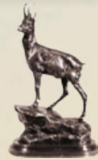
4. Gams Art.-Nr. 152022 Höhe: 30 cm Gewicht: 3,2 kg