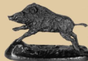
Keiler Art.-Nr. 152042 Höhe: 14 cm Gewicht: 1,7 kg