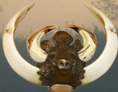
Keilerwaffenabdeckung Art.-Nr. 145008 Maße: 10x7,5cm Gewicht: 0,25kg