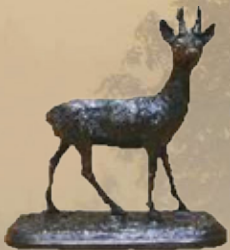
Rehbock Art.-Nr. 152053 Höhe: 18 cm Gewicht: 1 kg 67,99 €