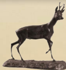
Rehbock Art.-Nr. 152051 Höhe: 25 cm Gewicht: 2,2 kg 106,99 €