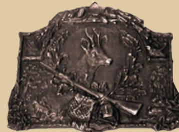
Art.-Nr. 152013 Maße: 30x24 cm Gewicht: 2,2 kg