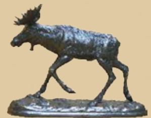
Elch Art.-Nr. 152002 Höhe: 16 cm Gewicht: 1,4 kg 106,99 €