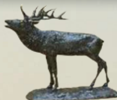
Rothirsch Art.-Nr. 152061 Höhe: 19 cm Gewicht: 1,9 kg