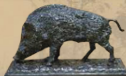
Keiler Art.-Nr. 152038 Höhe: 11 cm Gewicht: 1,7 kg