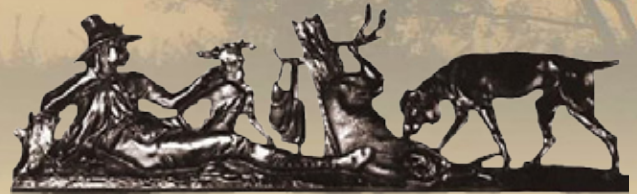
Art.-Nr. 152011 Maße: 18x50 cm Gewicht: 2,5 kg