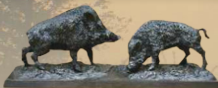
Sauen Art.-Nr. 152044 Länge: 34 cm Gewicht: 3 kg