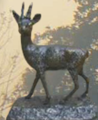
Rehbock Art.-Nr. 152052 Höhe: 17 cm Gewicht: 1,8 kg 62,99 €