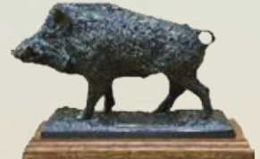
Keiler Art.-Nr. 152035 Höhe: 12 cm Gewicht: 1,6 kg 64,99 €