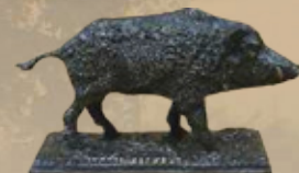
Keiler Art.-Nr. 152033 Höhe: 12 cm Gewicht: 1,6 kg