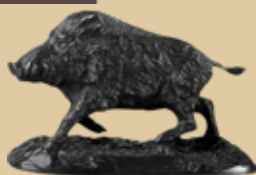
Keiler Art.-Nr. 152043 Höhe: 10 cm Gewicht: 1,1 kg