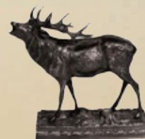
Rothirsch Art.-Nr. 152062 Höhe: 13 cm Gewicht: 0,9 kg