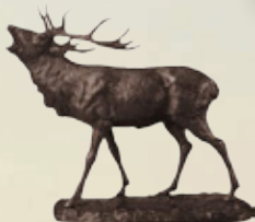
Rothirsch Art.-Nr. 152058 Höhe: 25 cm Gewicht: 3,3 kg