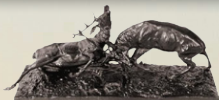
Kämpfende Rothirsche Art.-Nr. 152056 Länge: 55 cm Gewicht: 10 kg