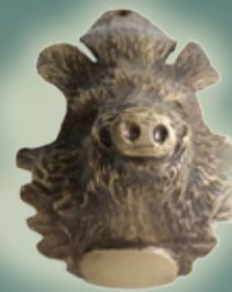
Art. Nr. 152014 BRONZEGUSS - 26,99 €