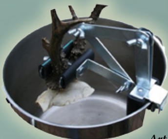
Art. Nr. 145033 Abkoch-Stativ - 22,99 €