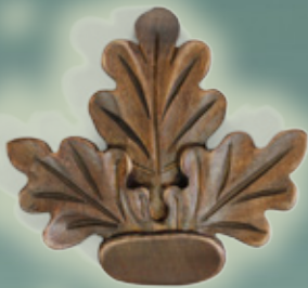
Art. Nr. 145009 LINDE - 14,99 €