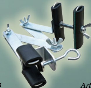
Art. Nr. 145034 Gewaff-Füllung - 34,99 €