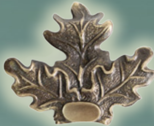
Art. Nr. 145006 BRONZEGUSS - 14,99 €