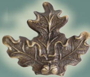
Art. Nr. 145007 BRONZEGUSS - 14,99 €