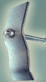
Art. Nr. 145011 3,99 €

Gehörnklammer mit Befestigungsschraube, verstellbar. Passend für alle Gehörnbretchen bzw. Trophäenschilder für den Rothirsch -Damhirsch