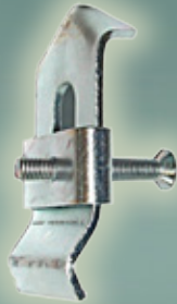
Art. Nr. 145010 9,99 €

Gehörnklammer aus Metall mit Befestigungsschraube, verstellbar. Passend für alle Gehörnbretchen bzw. Trophäenschilder für den Rehbockschädel