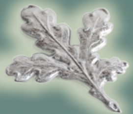
Art. Nr. 145005 ALU - 9,99 €